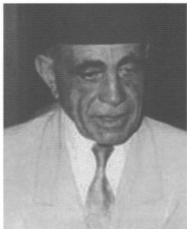
سليمان باشا خالاف